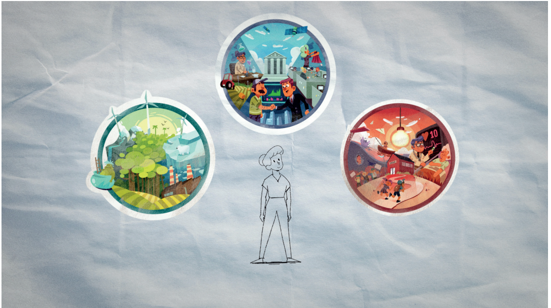
Govva filmmas «Olmmošvuoigatvuodát ja guoddevaš ovdáneapmi», Animaskin ráhkadan

Juohke joavku gávdná ovttá dahje moadde olmmošvuoigatvuoda mat hedjonit sin hástalusá geažil. Ovdanbuktet luohkkái.