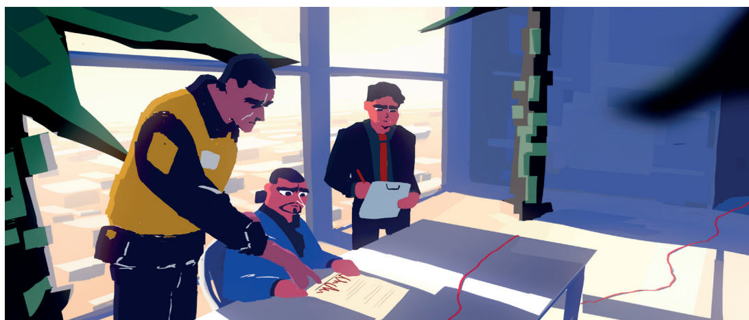
Govva filmmas «Hvorfor er klær så billige?», Animaskin ráhkadan