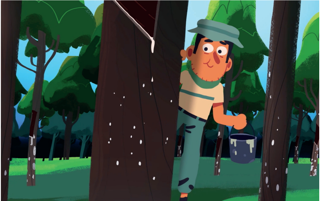
Govva filmmas «Mii lea guoddevaš ovdáneapmi?», Animaskin ráhkadan

Njeallje oahppi joavkkus. Sárgot stuora X árkii ja čállet ovtta hástalusá listtus guđege oassái. Okta oahppi čohkkeda guđege oasi ovddabeallai, ja čállá čovddasániid movt hástalus váikkuha min. Ovtta minuhta maŋŋel jorahehpet árkka vai oažžubehtet ođđa oasi mas lea ođđa hástalus, ja juohkehaš čállá ođđa čovddasániid. Dahket dán dassázii juohkehaš lea buot njealji oassái čállán čovddasániid. Geavahehpet dán vuodđun digaštallamii.