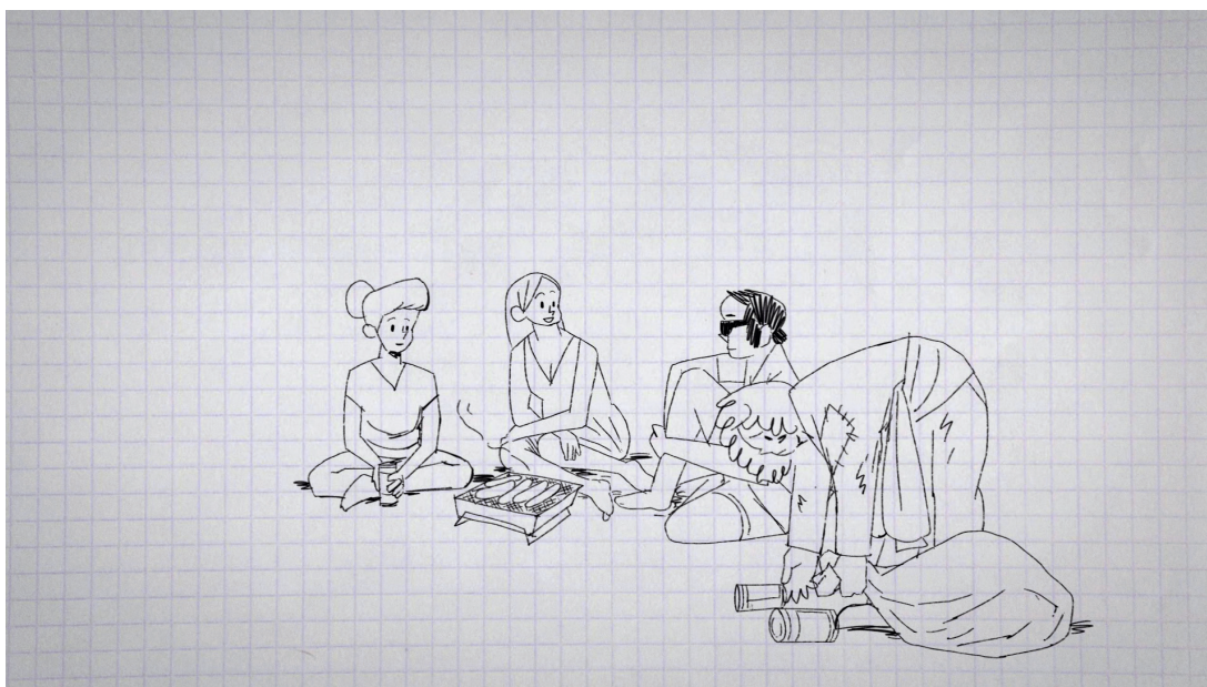
Govva filmmas «Olmmošvuoigatvuodát ja guoddevaš ovdáneapmi», Animaskin ráhkadan