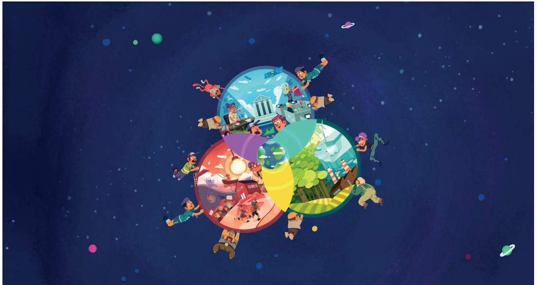
Govat filmmas «Mii lea guoddevaš ovdáneapmi?», Animaskin ráhkadan