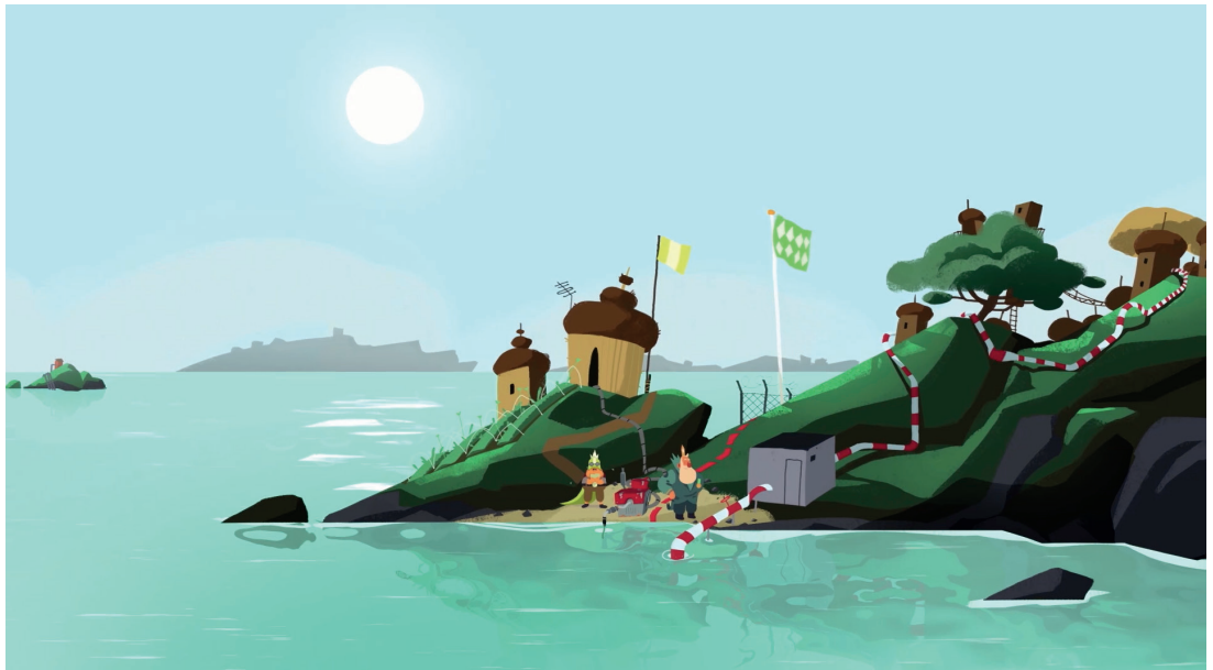
Govva filmmas «Mii lea guoddevaš ovdáneapmi?», Animaskin ráhkadan

Juoge ohppiid joavkun ja bivdde analyseret ja ovdanbuktit golbma válljejuvvon beakkálmasa logi mañemus Instagramgova. Lea gelddolaš oaidnit leat go joavkkut dulkon govaid ovttá ládje.