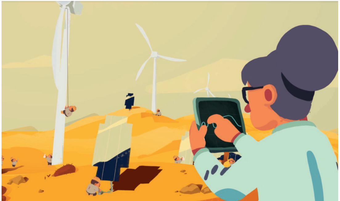
Govat filmmas «Mii lea guoddevaš ovdáneapmi?», Animaskin ráhkadan