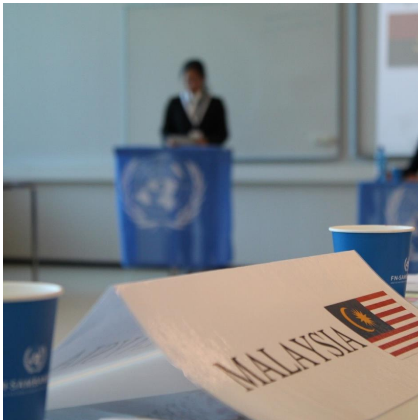
Bilde fra et tidligere FN-rollespill