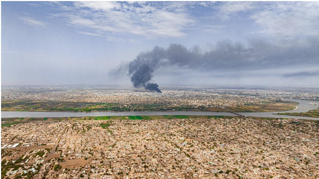
Foto: Krig i hovedstaden Khartoum, juni 2023: iStock/Abd Almohimen Sayed.