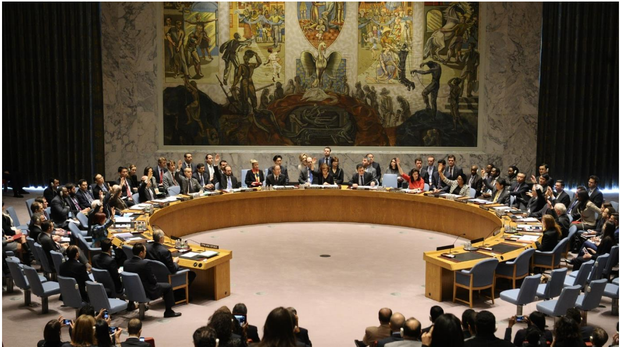
Bilde fra FNs sikkerhetsrådssal.