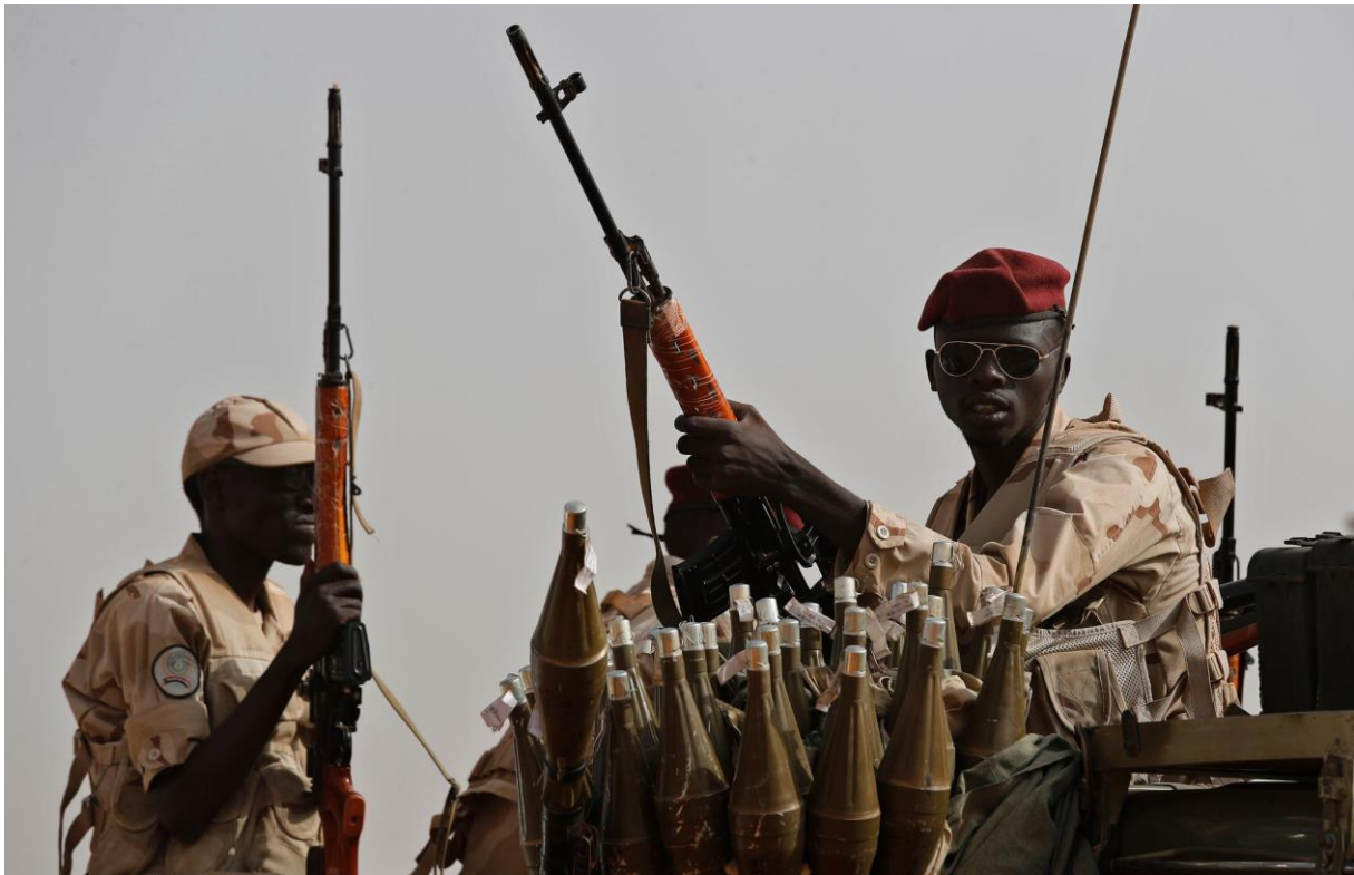
Soldater fra den paramilitære gruppen Rapid Support Forces (RSF) nordøst i Sudan i 2019. Krigen mellom RSF og regjeringshæren, som har pågått siden april 2023, har skapt en humanitær krise i Sudan og nabolandene.