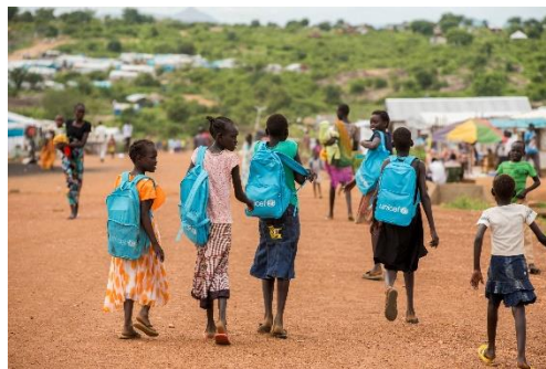
Barn på flukt i Sør-Sudan på vei til skolen.

Det er de som bestemmer i et land, myndighetene, sin jobb å sørge for at ALLE som bor i landet kan leve gode liv og få oppfylt menneskerettighetene sine. Når myndighetene bryter eller ikke klarer å passe på menneskerettighetene, er det blant annet FN sin oppgave å forsøke å gjøre noe.